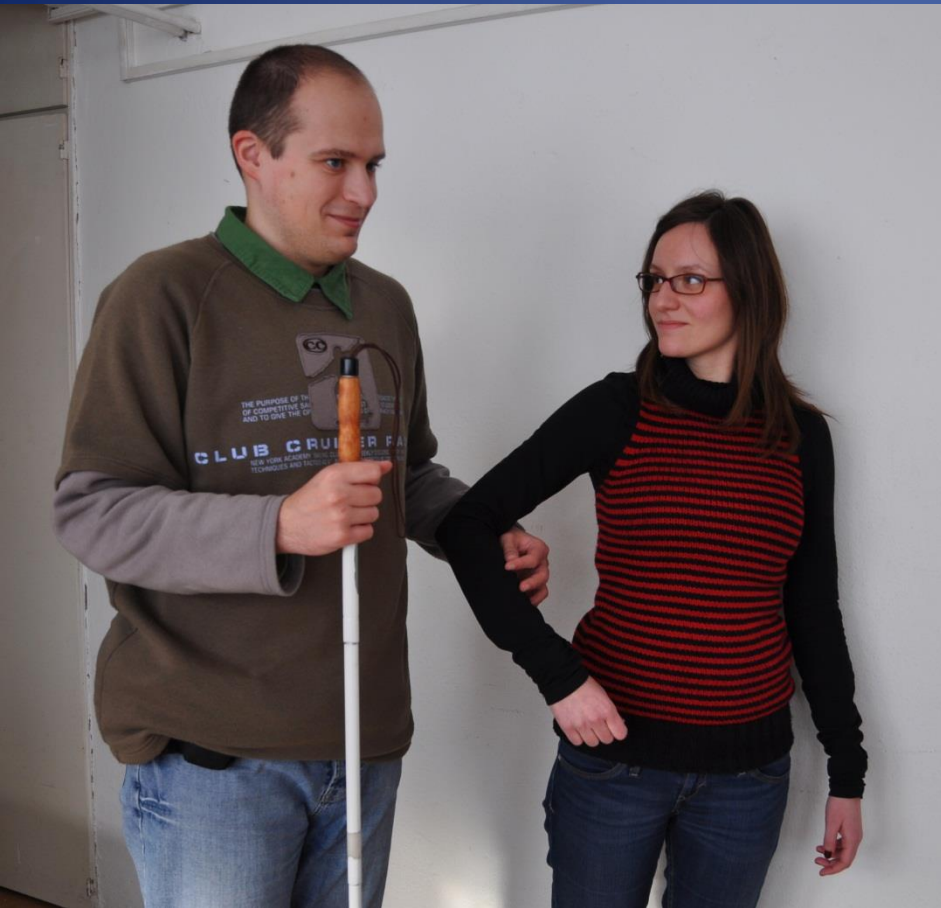
úchop za rameno